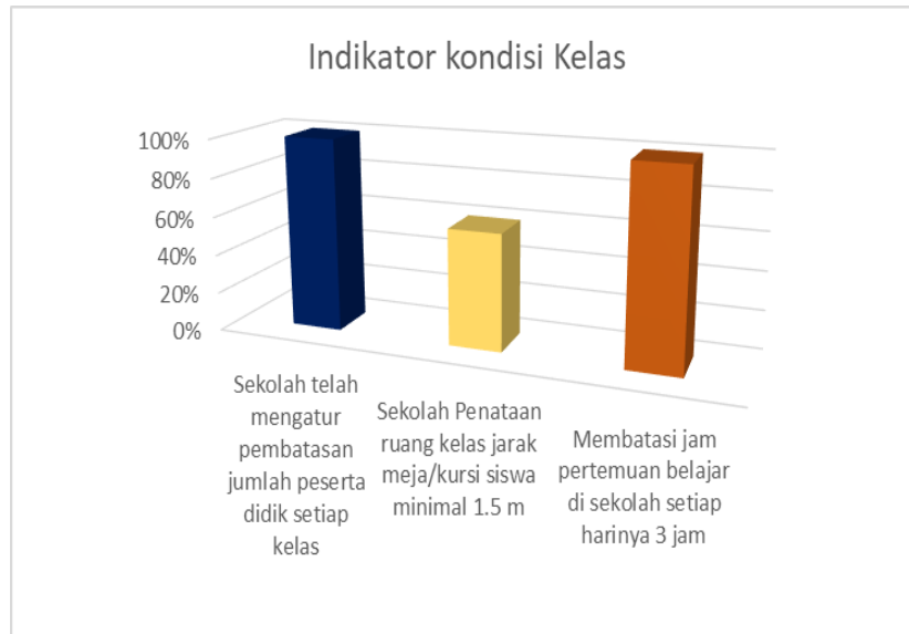
Gambar 1. Diagram Hasil Indikator Kondisi Kelas.