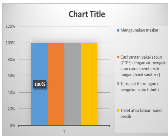
Gambar 3. Diagram Hasil Instrumen Kesiapan Lembaga sesuai Indikator Perilaku Wajib Di Seluruh Lingkungan Satuan Pendidikan

Dari tabel dan diagram di atas Kesiapan Lembaga dari indikator perilaku wajib di seluruh lingkungan warga satuan PAUD menunjukkan kesiapan melakukan pencegahan penyebaran virus dengan berbagai cara dalam pembelajaran tatap muka di era new normal dengan kategori sangat siap. Menggunakan masker, cuci tangan dengan sabun di air mengalir, terdapat termogun ( pengukur suhu tubuh),toilet atau kamar mandi bersih menunjukkan rata-rata persentasi 100%. Dengan demikian bahwa lembaga sangat siap.